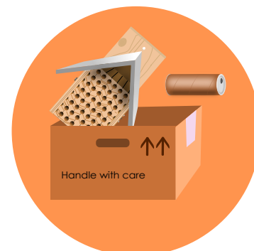
koker met cocons